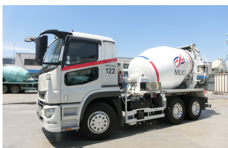
生コン車の展示 生コン車も来るよ!

各コーナーを体験して スタンプを集めよう!! スタンプが集まったら素敵な 景品が貰えるかも...!?