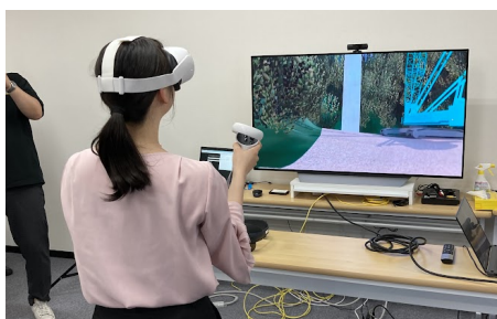
VR・MR体験 仮想空間で建設現場を見てみよう!