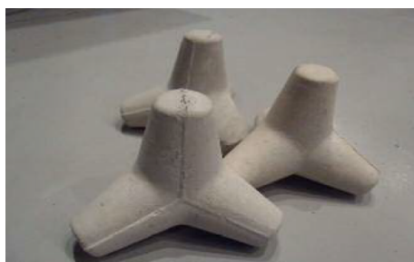
セメントアート ミニ消波ブロックを作ってみよう!

学校、道路、ダムやビルなど、私たちの身の回りにたくさんあるコンクリート。コンクリートが何からできているのか、なぜ固まるのか、みなさん知っていますか？是非、親子で楽しみながらコンクリートについて学びましょう!!