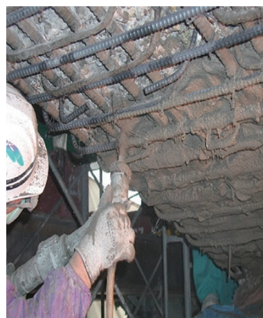
セメント系補修材

いますぐクリック! jcafukyu.jp 本講座はテーマごとにシリーズ化いたします 定期的なチェックをお願いいたします