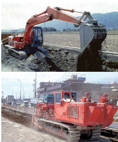
セメント系固化材