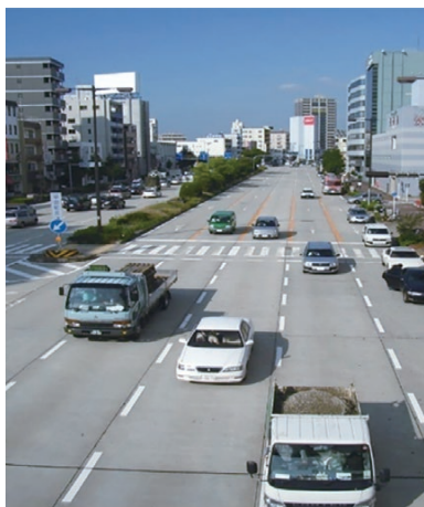
コンクリート舗装